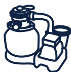
Filtration à sable Norme NF P 90-318